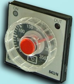
טרמוסטט אלקטרוני מדויק עד 300 מעלות