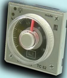
טיימר אלקטרוני מדויק